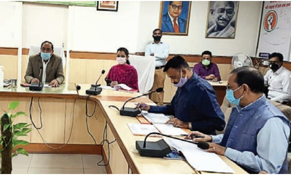
आवेदनों कि दोबारा जांच कराने के निर्देश दिए। इसके उपरंत निरस्त आवेदन